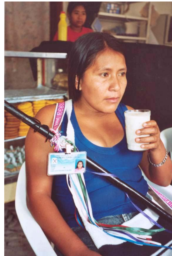
Aus- und Weiterbildung