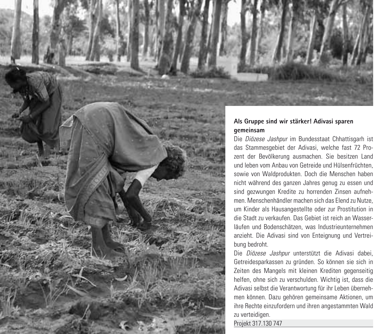
Noch immer arbeiten Dalit und Adivasi unter sklavenähnlichen Bedingungen für Grossgrundbesitzer. Fastenopfer