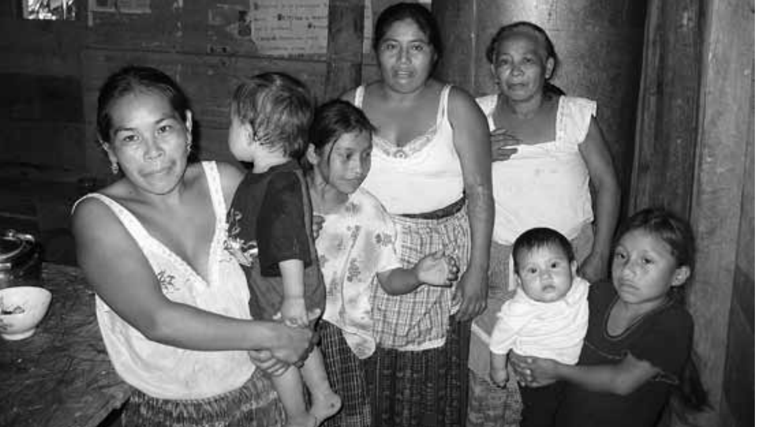
Noch immer wird die indigene Bevölkerung Guatemalas in vieler Hinsicht diskriminiert.