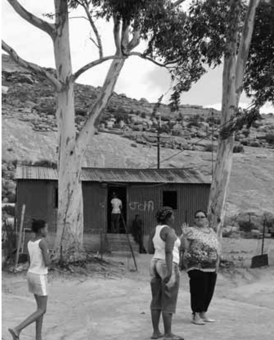
Typisches Haus in der Region Namakwaland. 2009