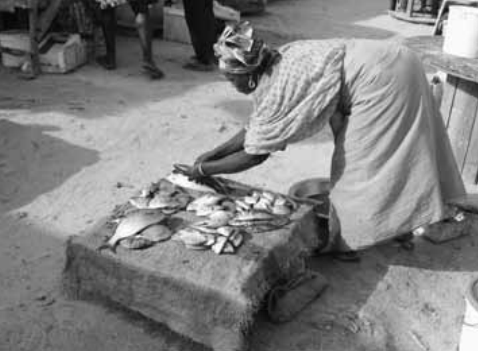
Fischhändlerin in Dakar: Ein grosses Problem der Fischereigenossenschaften ist die Überfischung des Meeres.