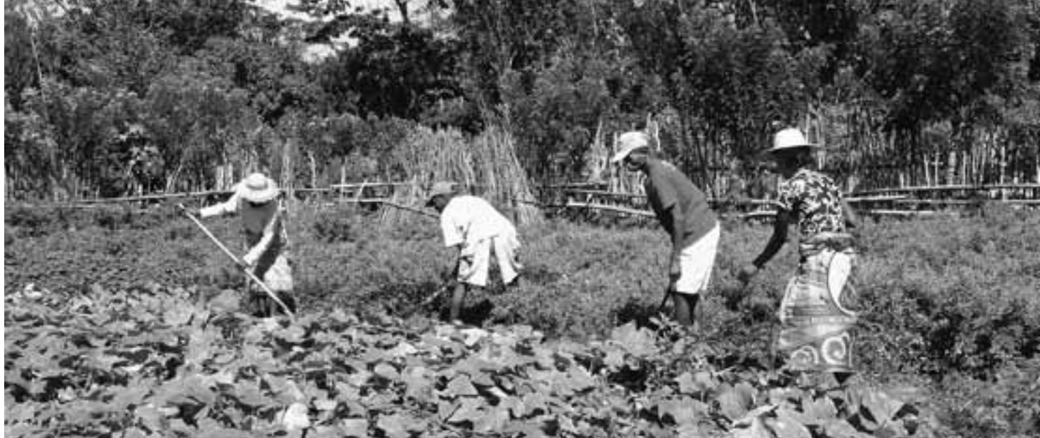
Der Ertrag dieses Gemeinschaftsfeldes in Ilaka Est füllt die Gruppenkasse, dank der die Mitglieder sich bei Notfällen gegenseitig unterstützen können.