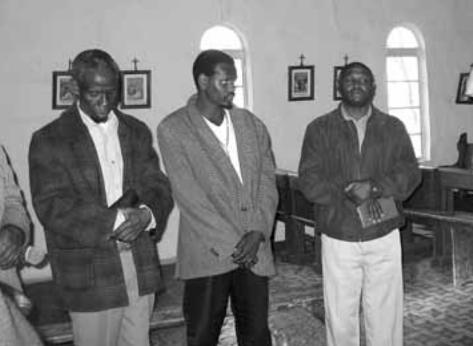
Pfarreregruppe beim Gebet in ihrer Kirche im Hinterland von Cala in der Provinz Ostkap