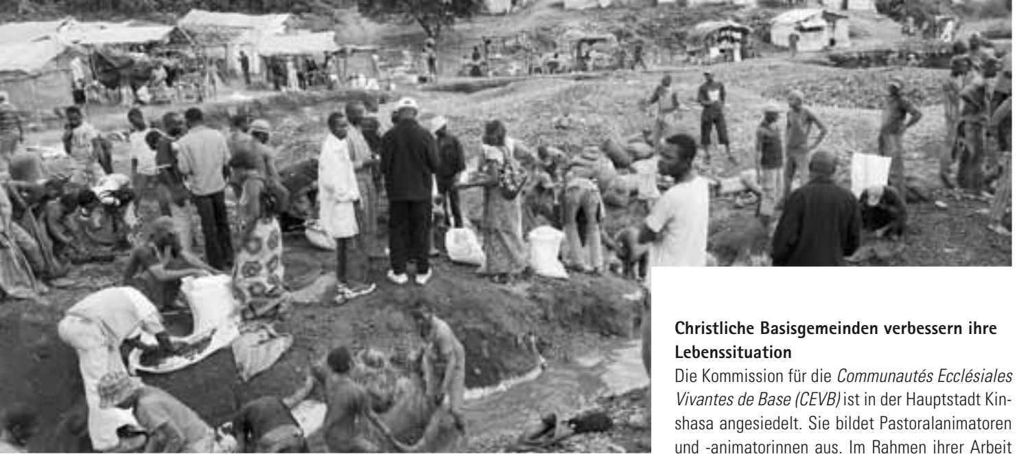
Ein Viertel des weltweit genutzten Kobalts wird im Kongo von Hand gefördert. Die Schürfer und ihre Familien in Katanga leiden unter unmenschlichen Arbeitsbedingungen.