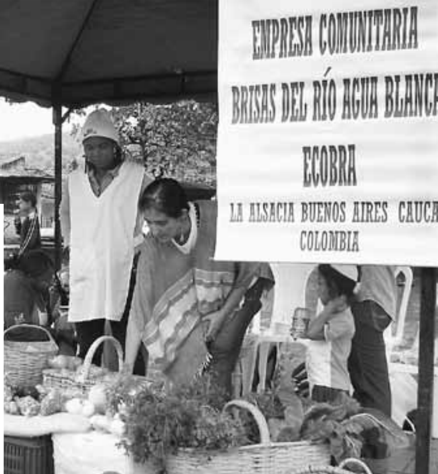
Neben der ökologischen Produktion fördert Semillas de Agua auch die lokale Vermarktung von Nahrungsmitteln.