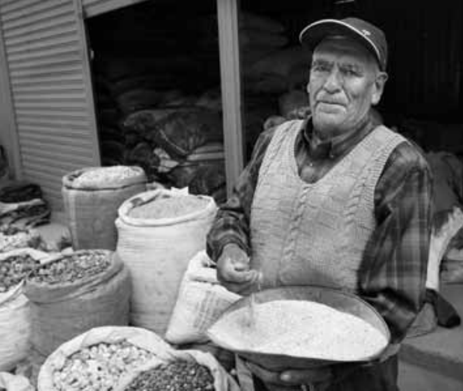
CPUR fördert neben verbesserten Anbaumethoden auch die Zertifizierung und Vermarktung lokaler Produkte.