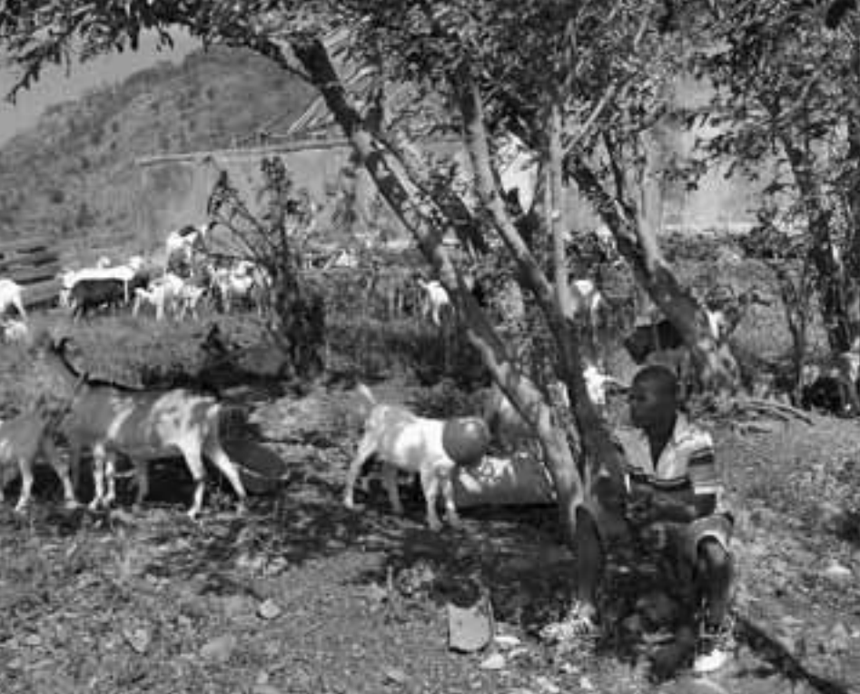
Um die Ernährung zu verbessern fördern Partnerorganisationen in Haiti auch die Aufzucht von Ziegen und Hühnern.