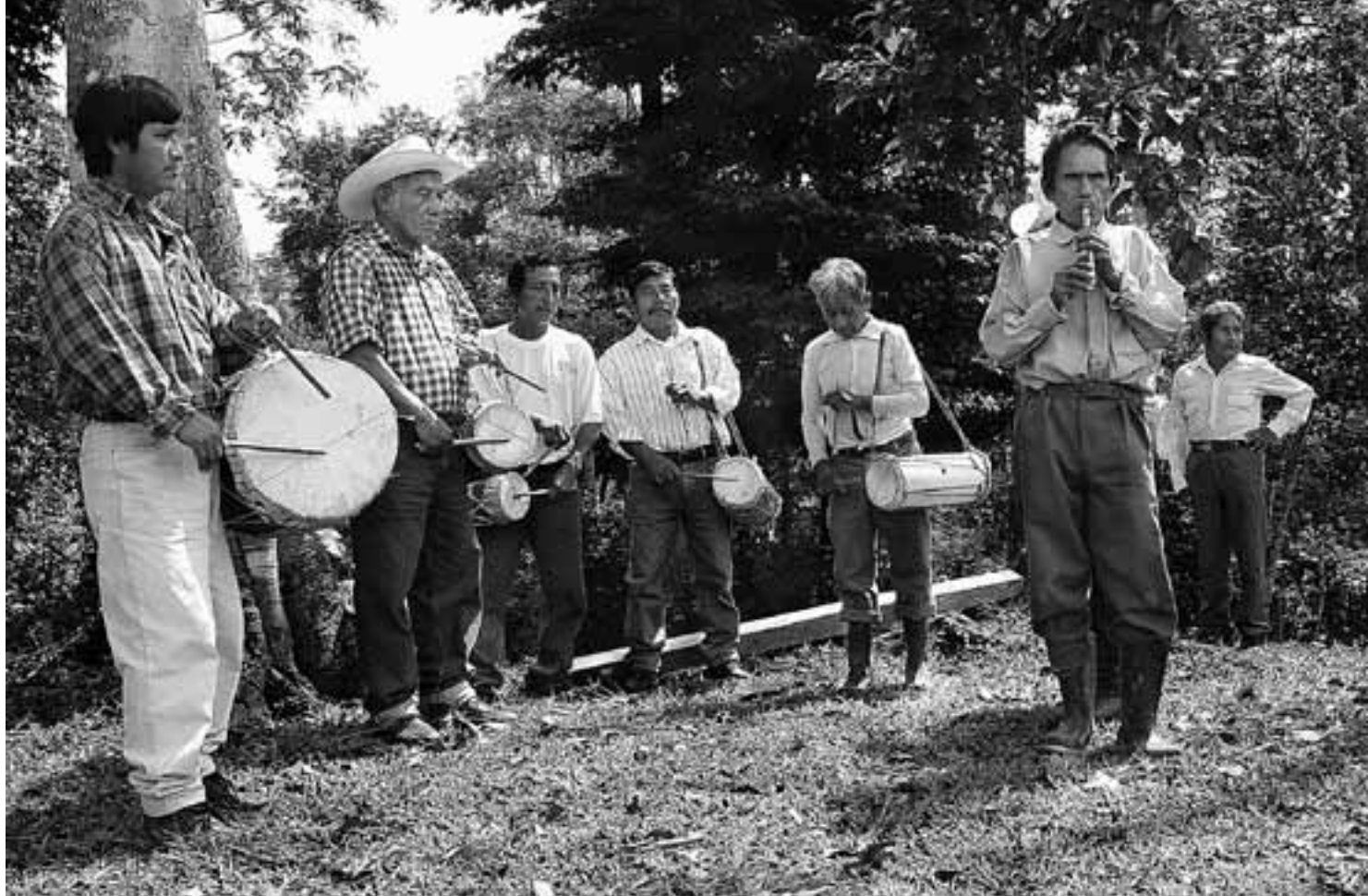
Die Treffen der Friedensaktivisten in Mexiko werden immer von Musik begleitet.