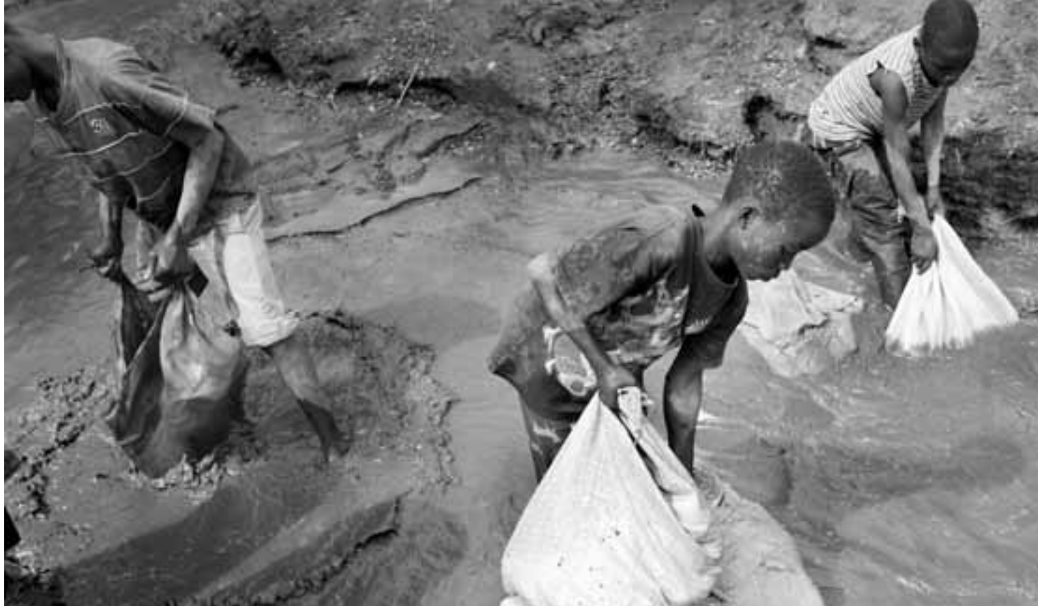
Auch Kinder helfen mit, Kobalterz für den Verkauf vorzubereiten. 2011