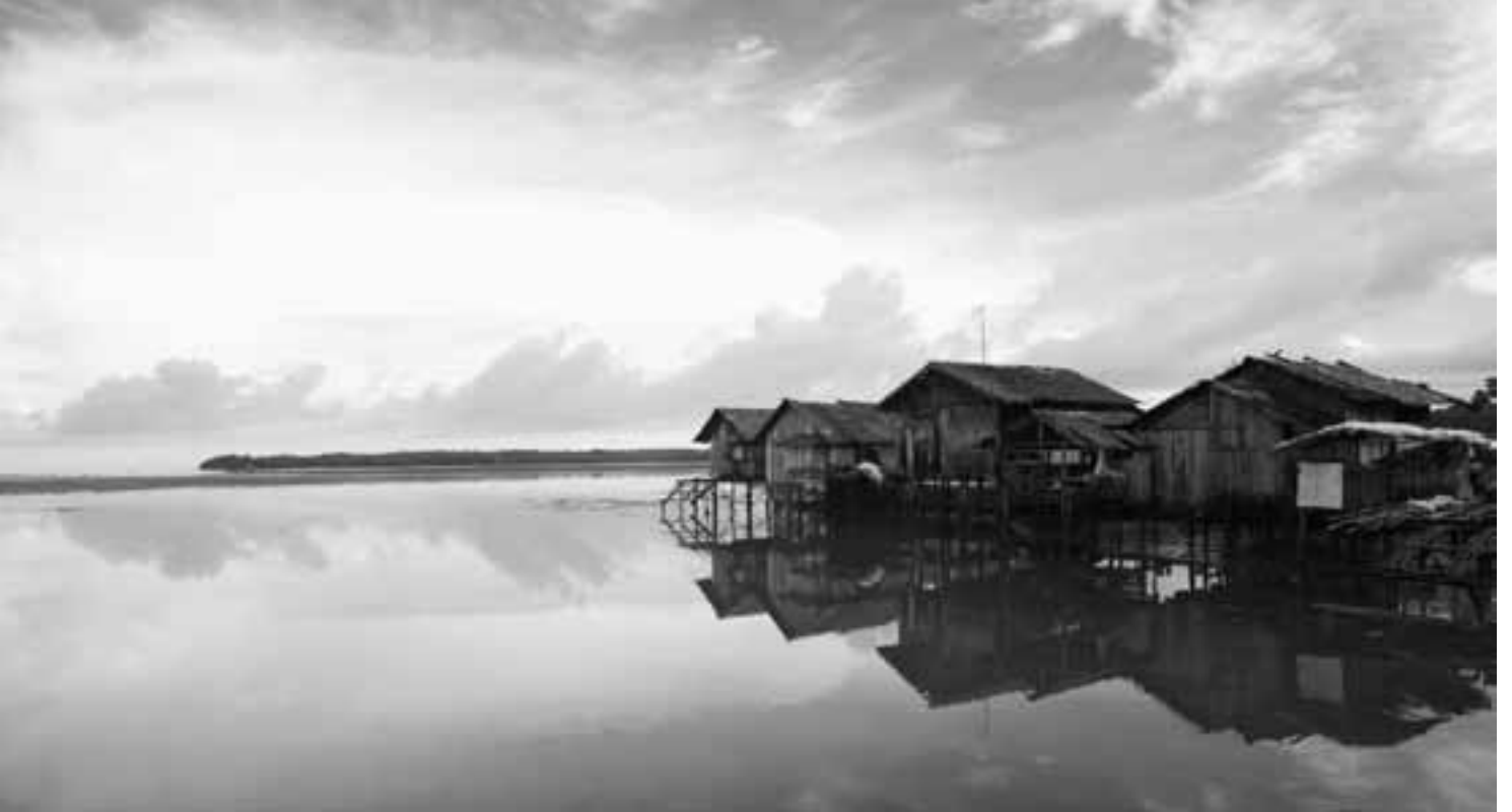
Das Programm von Fastenopfer verbessert umweltschonend die Ernährung durch Landwirtschaft und Fischerei.