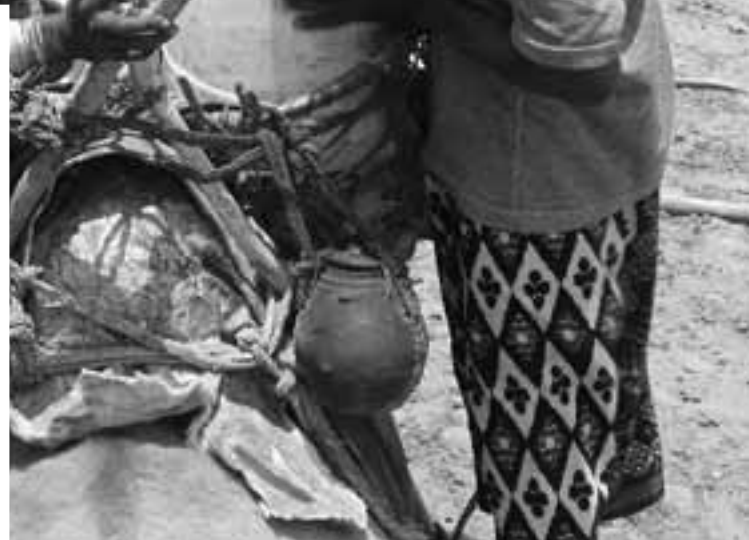
Um die Nutzung von Wasserstellen entstehen im Norden Kenias immer wieder Konflikte.