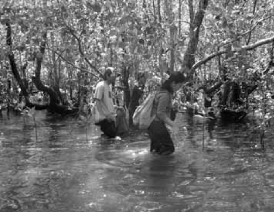
Der Klimafonds ermöglicht es, Mangrovenwälder zu schützen – auch hier an der Küste Mindanaos/Philippinen.