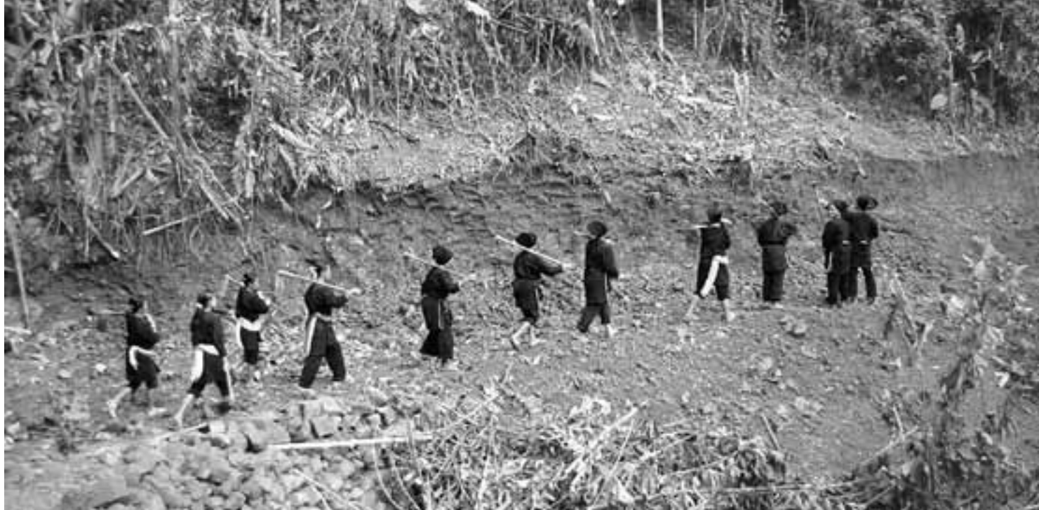
Im Norden von Laos haben die Dörfer angefangen, ihre Transportwege selbst zu bauen – die Frauen helfen tatkräftig mit.