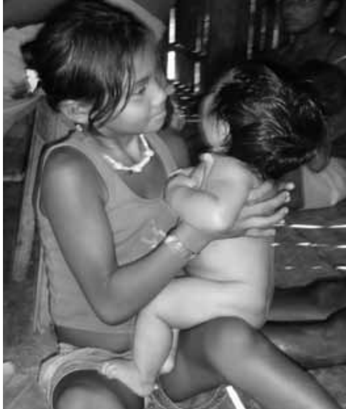
Kinder am Rand eines Treffens von CIMI im Amazonasgebiet.