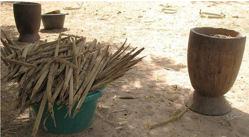
Ernährungssicherung und Schuldenabbau