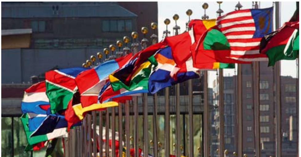
Flaggen vor den Vereinten Nationen in New York.