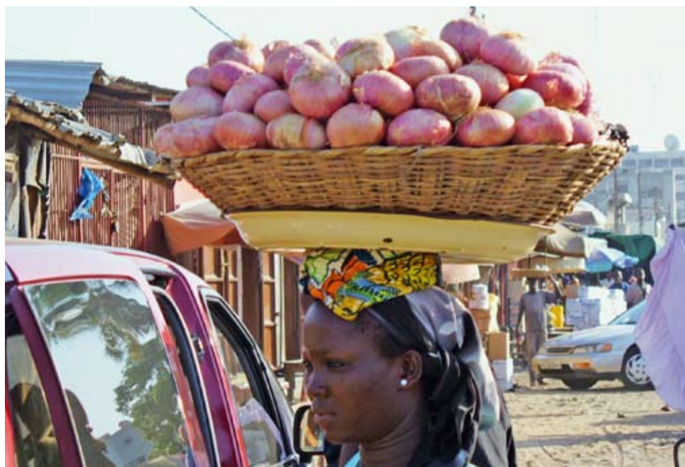
Strassenverkäuferin in Benin.