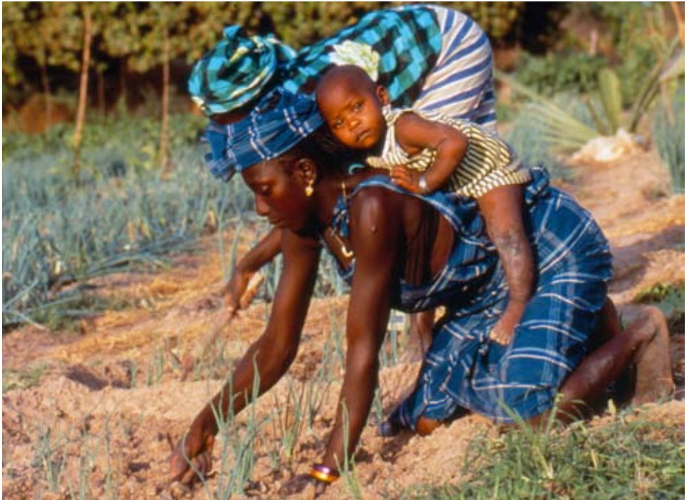
Senegalesische Mutter mit Kind beim Gemüseanbau.