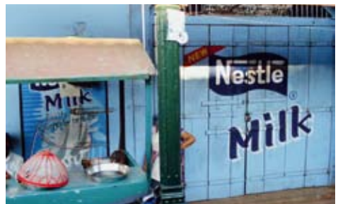
Nestléwerbung in Goa/Indien.

Die ärmeren Länder müssen die Möglichkeit haben, den Markt zu regulieren, um die Ernährungssicherheit zu gewährleisten und den Lebensunterhalt der Menschen zu sichern. Dieses Recht muss in allen Handelsabkommen und Programmen der WTO sichergestellt werden. Die UN-Vollversammlung, der UN-Ausschuss für wirtschaftliche, soziale und kulturelle Menschenrechte und der UN-Sonderberichterstatter für das Recht auf Nahrung haben immer wieder betont, dass auch die Internationalen Finanzinstitutionen dazu verpflichtet sind, das Recht auf Nahrung in all ihren Aktivitäten zu achten. Dies gilt für die Kreditvergabe ebenso wie für Massnahmen zur Bewältigung der Schuldenkrise. 23 Tun sie dies nicht, handelt es sich um eine klare Menschenrechtsverletzung.