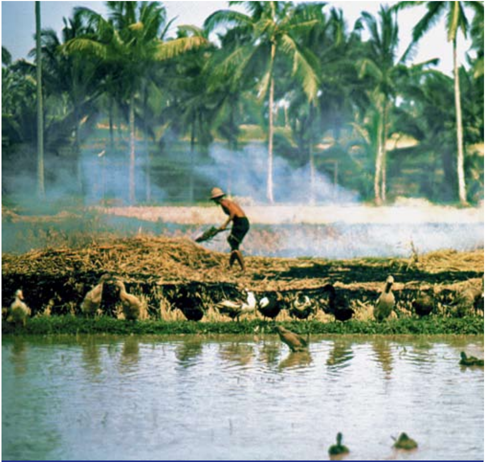
In Indonesien sichert die kleinbäuerliche Landwirtschaft die Ernährung vieler Familien.