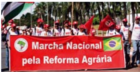
Marsch der Landlosen nach Brasilia. Die Landlosen fordern die brasilianische Regierung auf, die im Gesetz verankerte Agrarreform durchzuführen.

→ Hier ist Vorsicht geboten, da eine bloße Steigerung der landwirtschaftlichen Produktion im grossen Stil, so wie es einige Vertreter dieses Konzepts fordern, den Hunger nicht wirksam beseitigt, hingegen die am meisten betroffenen Kleinbauern und -bäuerinnen übergehen und in erneute Abhängigkeit stürzen kann.