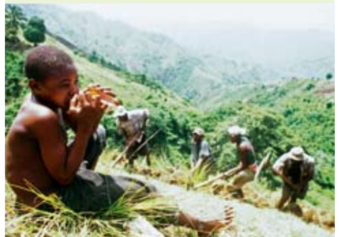
Fastenopfer unterstützt biologischen Landbau in Haiti.

Der Import von Reis stieg in Haiti zwischen den Jahren 1992 und 2003 um 150%, was zu einer weitgehenden Zerstörung des lokalen Marktes führte. Der Grossteil des importierten Reises (95%) wurde zu Dumping-Preisen aus den USA nach Haiti eingeführt. Im Rahmen des Strukturanpassungsprogramms von Weltbank und IWF wurden im Jahre 1995 die Einfuhrzölle auf Reis von 35% auf 3% gesenkt. Inzwischen ist die Zahl der Hungernden in Haiti Reisanbaugebieten am höchsten. 13 Die Hungerrevolten von 2008 in Haiti sind eine Folge dieser Wirtschaftspolitik!