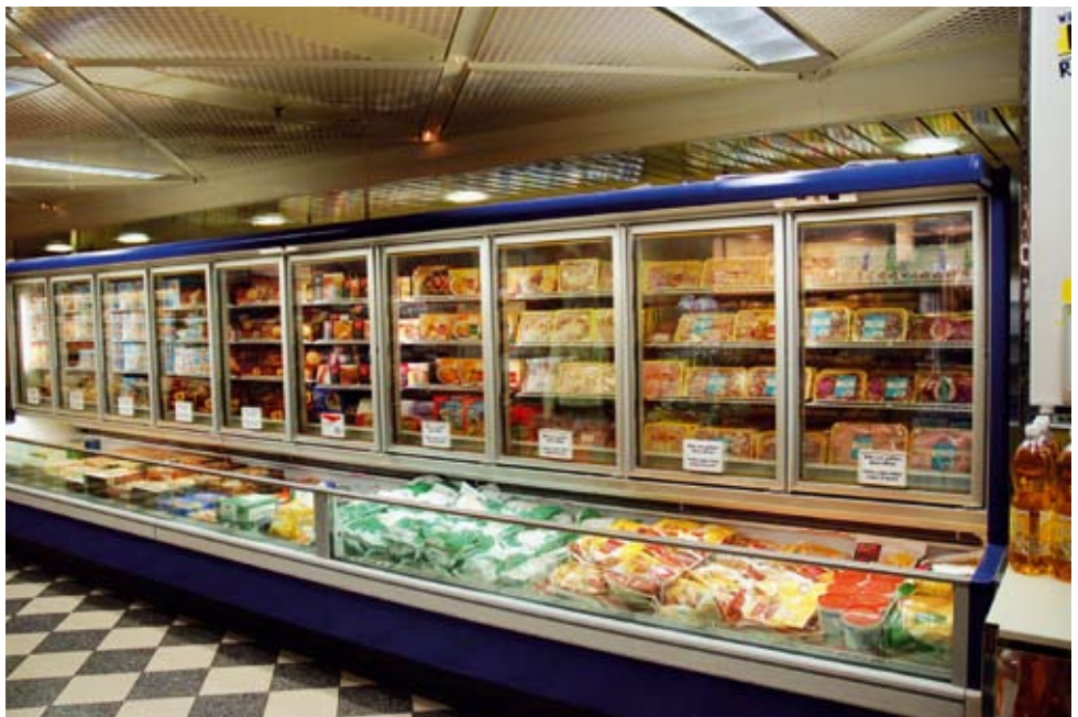
Der weltweit steigende Fleischkonsum hat negative Auswirkungen auf die Umwelt.

Die steigende Nachfrage nach Fleischprodukten und Agrotreibstoffen fördert die Konzentration des Bodens in der Hand der Agroindustrie und die einseitige Ausrichtung der Produktion. Wegen des weltweit hohen Fleischkonsums werden inzwischen ca. 50% des weltweit produzierten Getreides an Nutztiere verfüttert. Immer mehr Nahrungsmittel werden lediglich erzeugt, um sie an Fahrzeuge zu «verfüttern». Die Agrotreibstoffe sind bei einer isolierten Betrachtung weniger