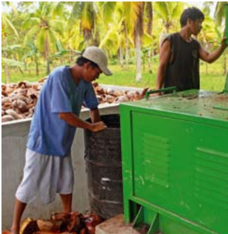
Weiterverarbeitung von Kokosnüssen durch philippinische Kleinbauern.

Haben die Kleinbauernfamilien ihre ein bis zwei Hektar Land samt Besitzurkunde erhalten, folgt der nächste Schritt: Sie lernen, den Boden fruchtbar zu machen und zu erhalten. Auf einem Teil des Ackerlandes wird Reis oder Mais für die Selbstversorgung angebaut. Ein anderer Teil dient zur Produktion von Kokosnüssen, Kakao oder Bananen, die auf lokalen Märkten verkauft werden. Da weiterverarbeitete Rohprodukte einen höheren Preis erzielen, wird den Bauern und Bäuerinnen das entsprechende Wissen vermittelt. Zur Pflege des Bodens und zur Anschaffung von Arbeitsinstrumenten sind Kleinkredite notwendig. Deshalb knüpft die TFM zum einen Verbindungen zu Institutionen, die Geld verleihen, zum anderen hilft sie den Kleinbauern und -bäuerinnen durch Schulungen, die Kredite wirtschaftlich sinnvoll zu investieren.