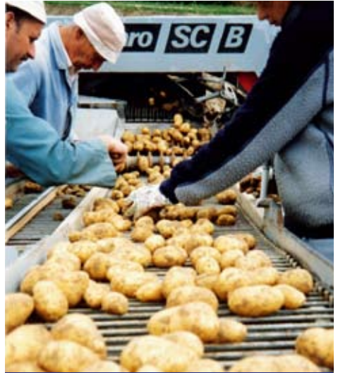
Kartoffelerei in der Schweiz.