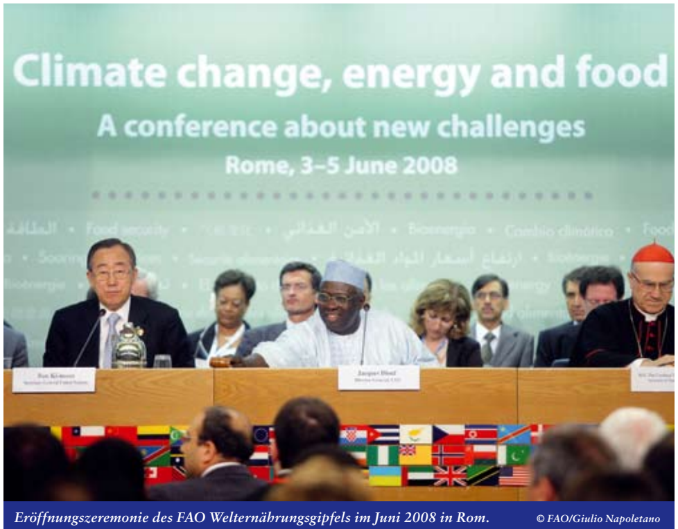
Eröffnungszereemonie des FAO Welternährungsgipfels im Juni 2008 in Rom.

Die Nichtregierungsorganisationen, Bauernbewegungen und andere wirtschaftliche Kräfte sowie Betroffene äusserten sich in Rom am Parallelgipfel der Zivilgesellschaft . In ihrer Abschlusserklärung warnten sie davor, die Fehler der Vergangenheit zu wiederholen. Sie forderten die Regierungen dazu auf, eine Führungsrolle in der Hungerbekämpfung wahrzunehmen und das Recht auf Nahrung und die Ernährungssouveränität der Menschen zu verwirklichen.