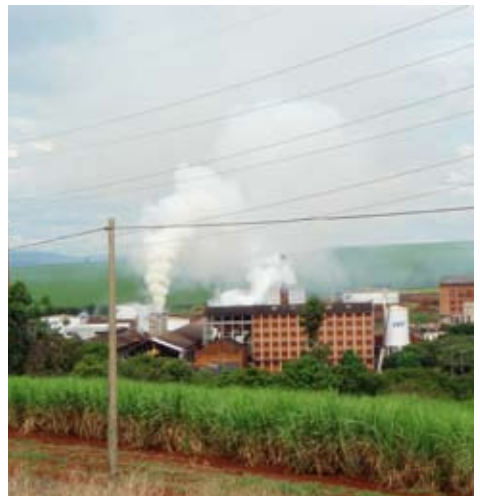
Zuckerrohranbau zur Herstellung von Agrotreibstoffen in Brasilien.

Im Bundesstaat São Paulo, das zeigen Berichte der Delegationsteilnehmer, hat der industrielle und grossflächige Anbau von Zuckerrohr zur Gewinnung von Agrotreibstoffen katastrophale Auswirkungen – auf die Umwelt und auf die Arbeits- und Lebensbedingungen der Landarbeiter und -arbeiterinnen.