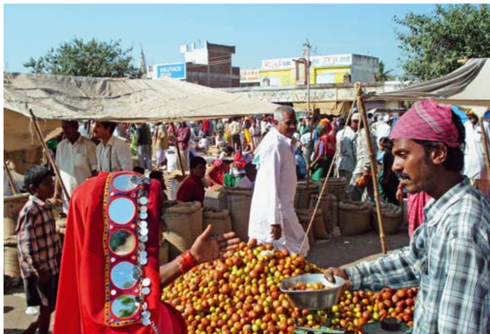
Markt in Indien.