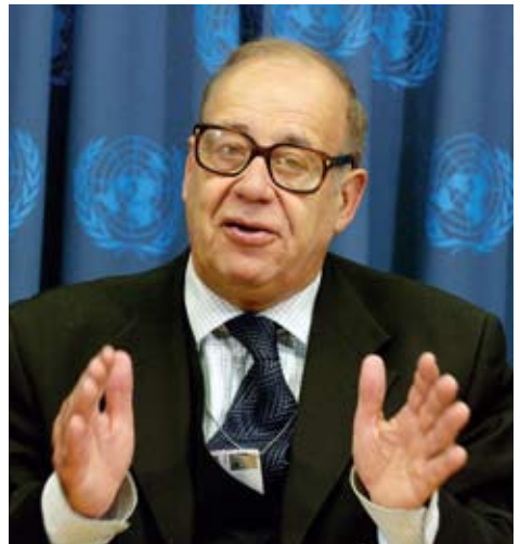
Jean Ziegler bei einer UN-Pressokonferenz in New York.

Ziegler: Georges Bernanos hat geschrieben: «Gott hat keine anderen Hände als die unseren.»*** Wir leben in einer Demokratie und müssen uns dafür einsetzen, die mörderische Weltordnung zu ändern. Es liegt an uns zu handeln. Die Schweizer Regierung vertritt uns bei den Vereinten Nationen, dem IWF, der Weltbank und der WTO. Wir müssen Druck auf unsere Regierung ausüben, dass sie sich innerhalb all dieser Organisationen für das Recht auf Nahrung einsetzt. Ausserdem können wir als Konsumenten Druck auf grosse Konzerne ausüben, die absurderweise von der Nahrungsmittelkrise profitieren.