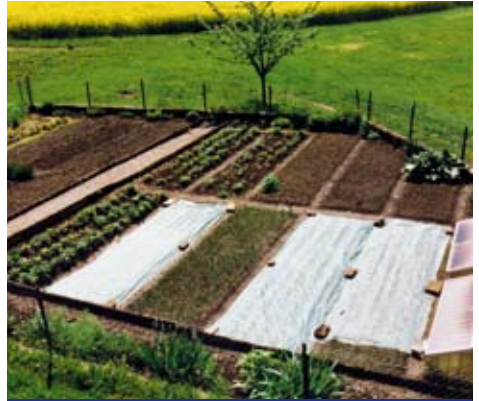
Lokaler Gemüseanbau in der Schweiz.