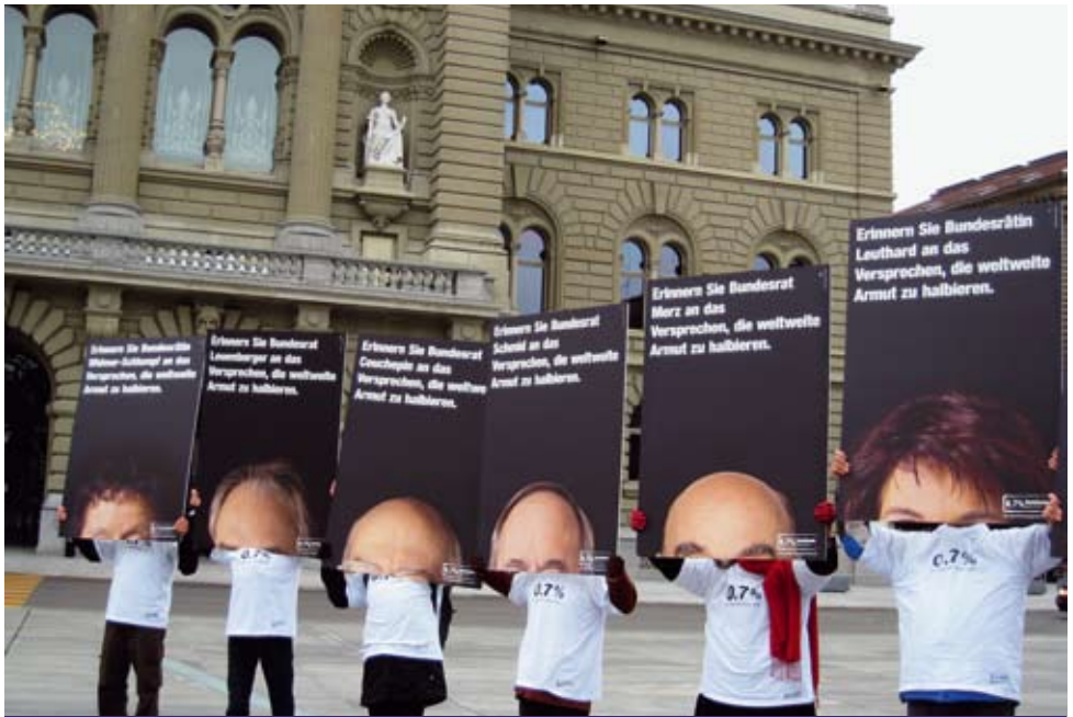
Aktion vor dem Bundeshaus zur Kampagne: 0,7% - Gemeinsam gegen Armut