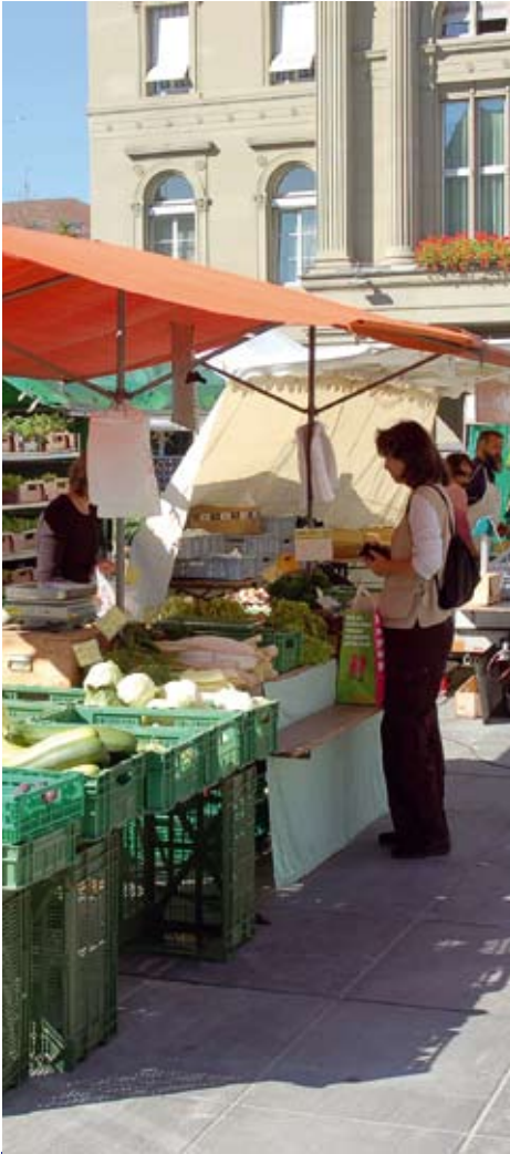
Durch bewussten Einkauf können wir einiges bewirken.