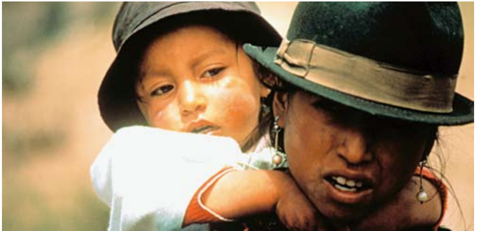
Ecuadorianische Kleinbäuerin mit Kind.

Oft sind es die Frauen, die alleine für den Unterhalt ihrer Kinder aufkommen müssen. In Entwicklungs- und Schwellenländern produzieren sie, trotz der schweren Bedingungen, einen Grossteil der Nahrung. Um den Hunger zu bekämpfen, ist es wichtig, Frauen gezielt zu unterstützen. So hilft Fastenopfer beispielsweise senegalesischen Frauen, Land für Gemüsegärten zu beschaffen, sodass diese die Ernährung ihrer Familien verbessern können.